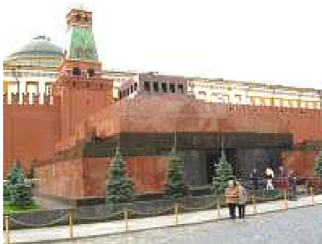
Mausoleo de Lenin