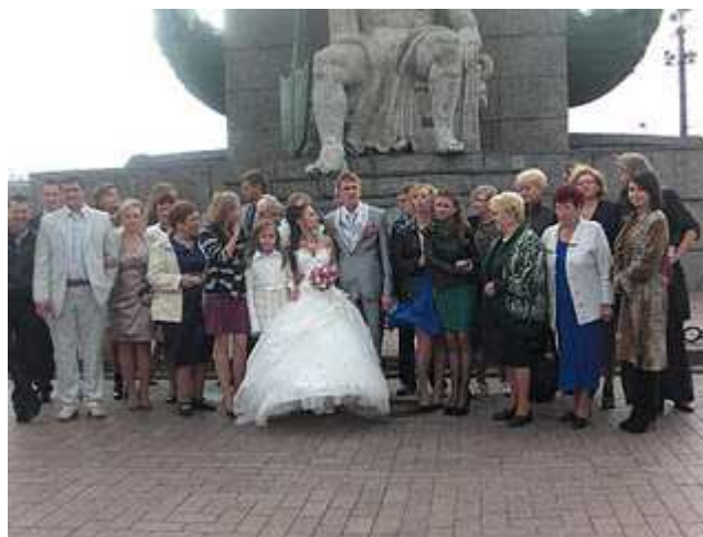
Pareja de recién casados

En S.P. vimos bastantes bodas de parejas jóvenes con edades alrededor de los 21 ó 22 años. Tras el matrimonio, es costumbre alquilar una limusina para recorrer los monumentos más significativos de la localidad con los amigos íntimos, brindando con champán, y luego con todos los invitados tener un almuerzo y continuar la celebración.