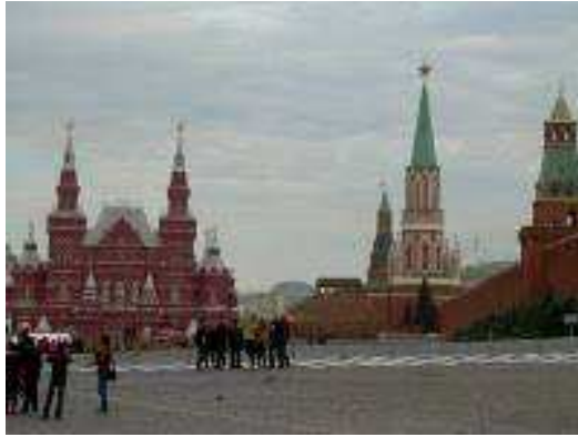
Al fondo a la izquierda Museo de la Historia