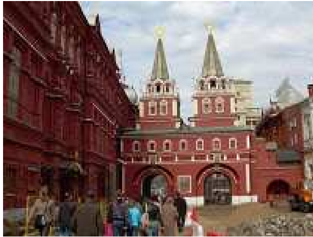
Entrada a la Plaza Roja