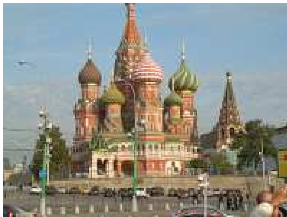
Catedral de S. Basilio