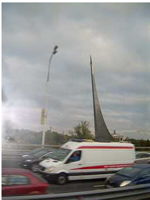
Monumento a la era espacial, al fondo a la derecha.

-Enseñanza gratuita, incluso la Universitaria. Fácilmente todo el mundo conocía un instrumento musical. Hubo un importante avance en medicina y en otras materias. Fue la primera potencia mundial en la carrera espacial, con sus famosos "sputniks".